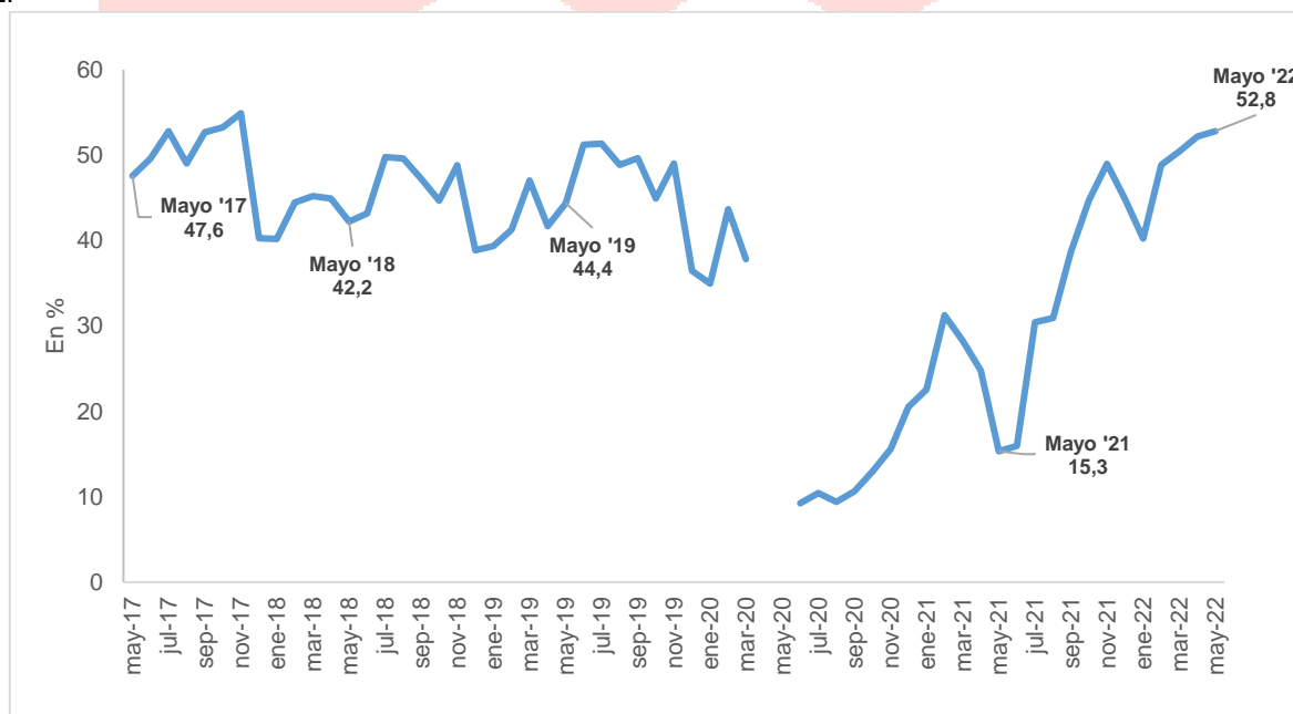
Gráfico N° 3. Porcentaje de habitaciones ocupadas en el sector hotelero de Rosario. Mayo 2017 – mayo 2022.

Nota 1: se incluyen plazas ocupadas en hoteles y establecimientos para-hoteleros.